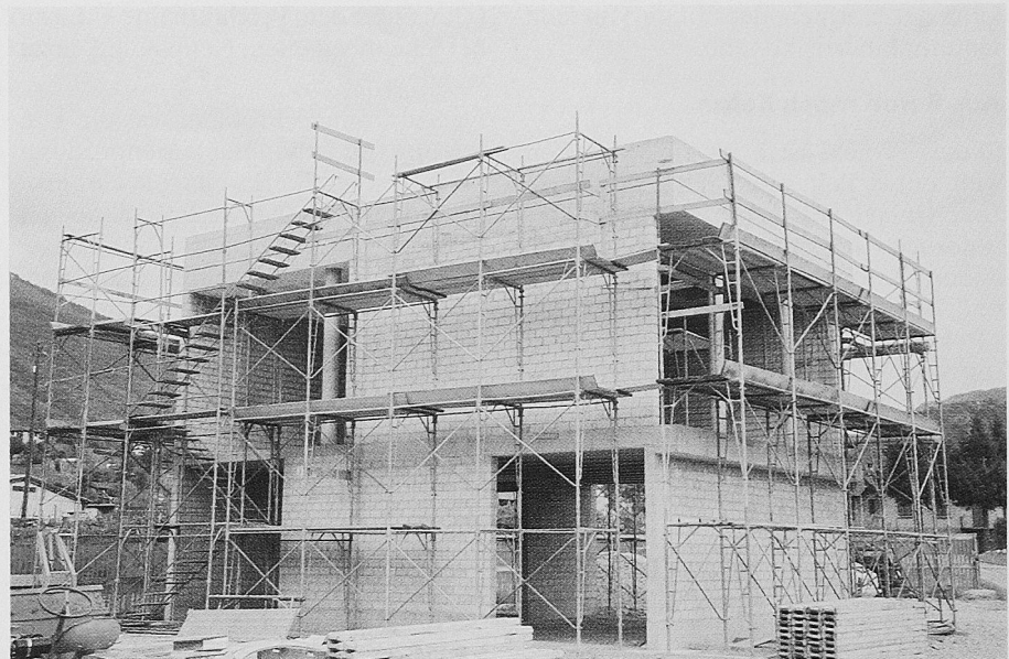
Muster- und Demoraum des SBG-Verwaltungsgebäudes in Lugano-Suglio

Es ist bemerkenswert, dass sich die Grossbanken in diesem Jahr mit der Publikation zum Thema «Bauökologie – Empfehlungen der Grossbanken» zum Wort gemeldet haben. Ebenso zeugen verschiedene, ebenfalls in diesem Jahr publizierte Merkblätter von kantonalen und städtischen Hochbauämtern da-