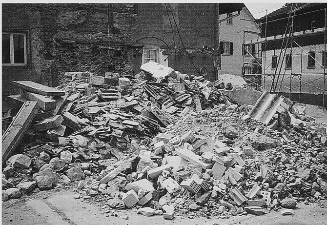
Das Sortieren und die Wiederverwendung von Bauschutt, der bisher verbrannt, deponiert oder sonstwie entsorgt wurde, hilft Ressourcen und Kosten sparen.

Leider stehen sich bei diesen Anwendungen die Normen und verschiedene Ämter gegenseitig im Wege, während auf der anderen Seite, vor allem wegen der einschränkenden Wir-