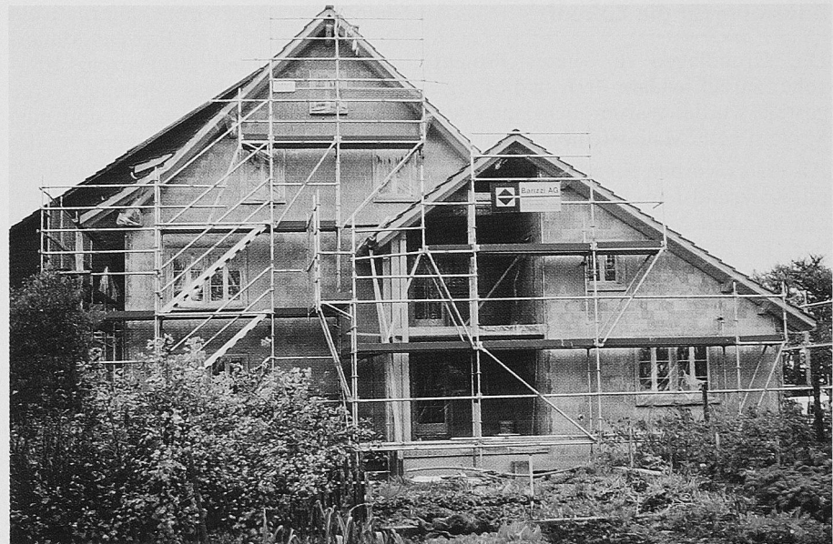
Beim alten Bauernhaus von Jakob Grimm in Oetwil a.S. wurde der Wohnteil abgebrochen und neu aufgebaut. Das Abbruch-Mauerwerk wurde von der Hard AG zu Maro ® -Steinen verarbeitet, mit denen die Brandmauer zwischen Scheune und Wohntrakt aufgeführt wurde.

von, dass bauherrenseitig das Thema «Ökologie im Bau» zunehmend von Bedeutung ist. Bauherren werden heute auch im Rahmen von Abbrucharbeiten mit der Entsorgungsproblematik konfrontiert. Der SIA ist bekanntlich mit der Empfehlung SIA 430 «Baustellenentsorgung» in diesem Bereich aktiv geworden. Diese Entsorgungsfrage wird letztlich auch das Verhalten von Planern bei der Auswahl von Baustoffen für neu zu erstellende Bauten beeinflussen; spielen doch sowohl Baustoffwahl als auch Konstruktionsart für den Rückbau und die Entsorgung eine grosse Rolle. Den Planern wird mit dem ebenfalls vom SIA publizierten Deklarationsraster ein Instrument zur Wahl der «geeigneten Baustoffe» zur Verfügung ge-