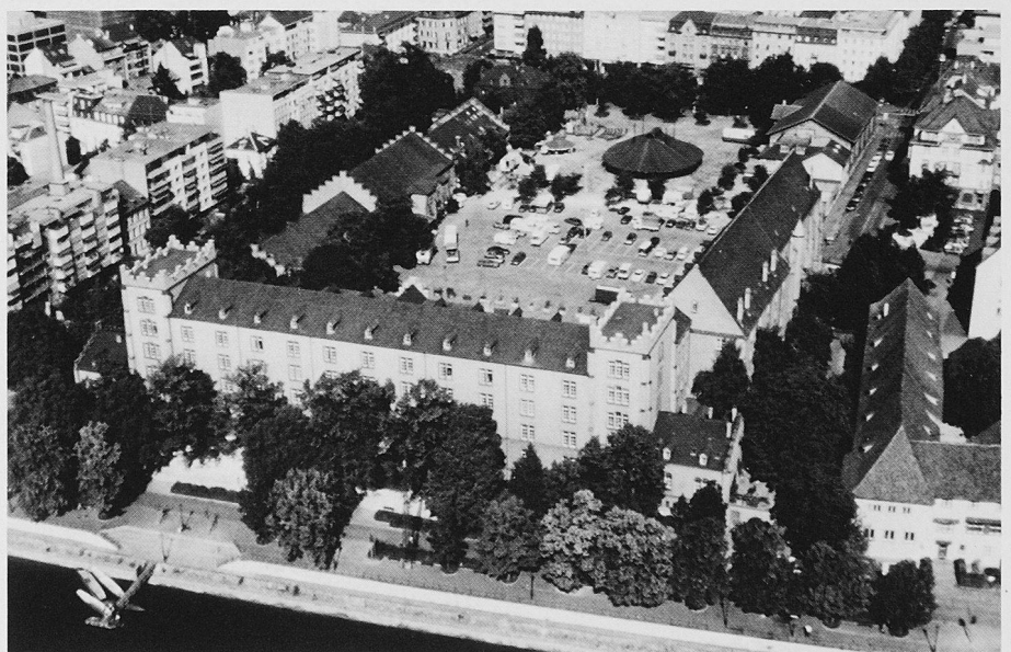
Für ihren Einsatz zugunsten der alten Kaserne Basel erhält die Interessengemeinschaft Kasernenareal ika den diesjährigen Heimatschutzpreis zugesprochen. Die neugotische Kaserne wurde 1863 errichtet und 1966 vom Militär wieder verlassen

Im Jahr 1966 wurde das Kasernenareal vom Militär definitiv verlassen und der Einwohnergemeinde Basel übertragen. Es hat also 27 Jahre gedauert, bis es – dank einer Volksabstimmung – endlich von parkierten Autos befreit und offiziell für kulturelle Institutionen «zwischen genutzt» werden konnte. Das Gerangel um dieses zentralgelegene Kasernenareal dürfte weiterdauern – mit einer ika.