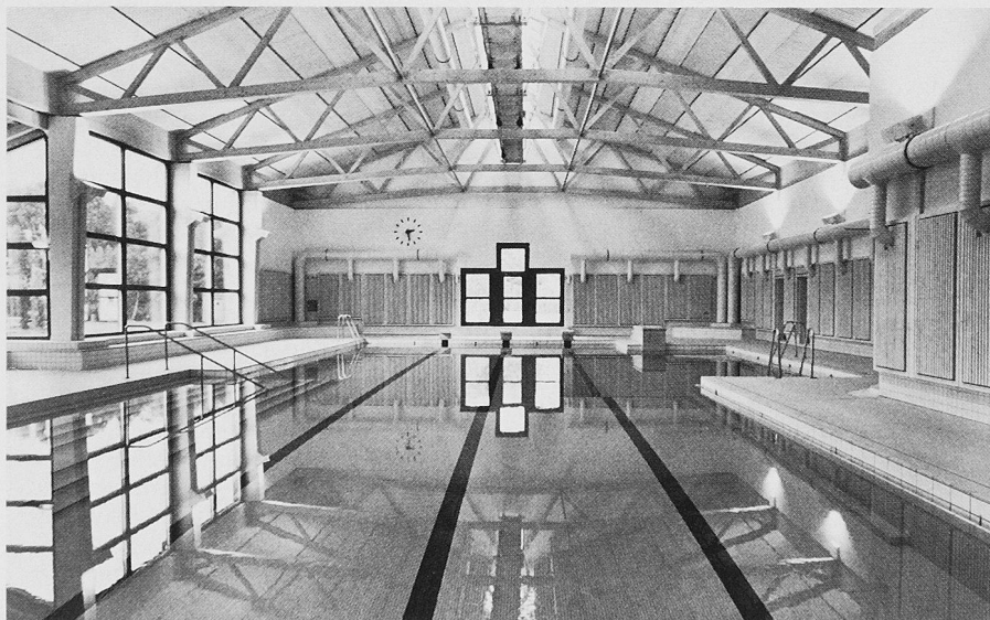
Bild 3. Hallenbad Rheinau, nach der Sanierung