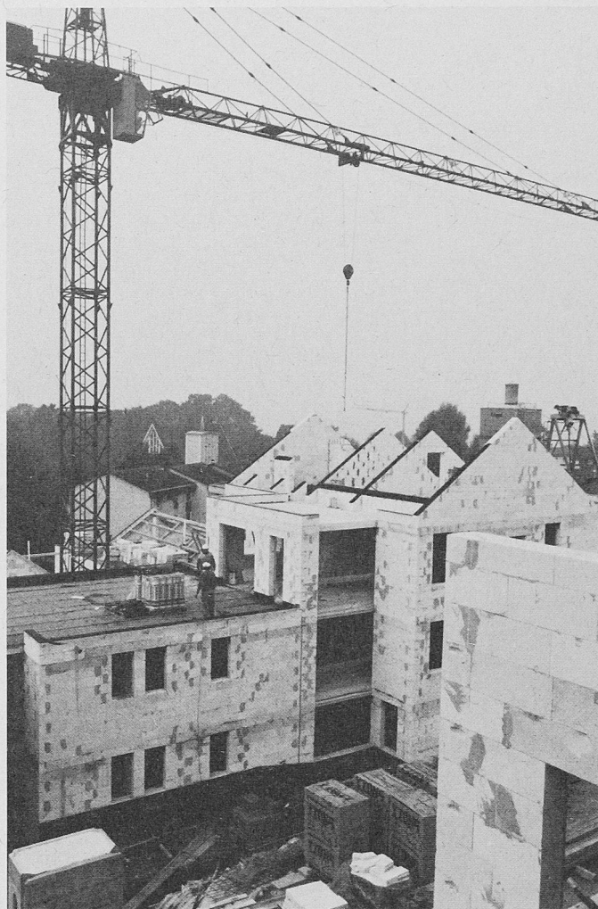
Wohnüberbauung Humrigenstrasse in Herrliberg ZH. Seit Frühjahr 1994 befinden sich hier in drei Gebäudegruppen insgesamt 12 Sechszimmer-Eigentumswohnungen in Bau

Softcad Ingenieurbüro für EDV und CAD 3177 Laupen Tel. 031/747 60 10