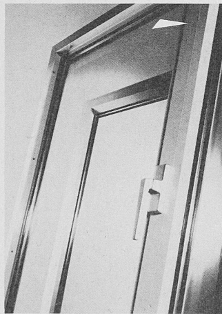
Beim neuen Fenster-, Türen- und Fassadensystem von Schweizer ist es erstmals gelungen, schlankste Konstruktion mit Top-Wärmedämmung zu kombinieren

Mit einer durchdachten Kombination wärmegeleiteter Materialien mit lichtdurchlässigen Bauteilen wird im Fassadenbau