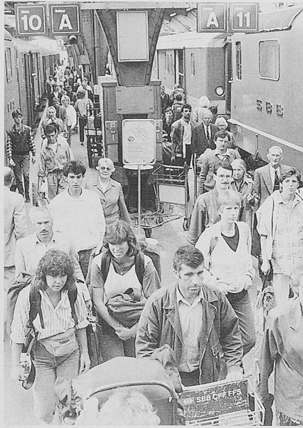
Bild 2. Stau im Bahnverkehr

Die Bekämpfung dieser Folgen wächst zum neuen Ziel der Verkehrspolitik heran. Die Mobilität muss ihren dominierenden Platz aufgeben und sich mit den Zielen der Siedlungsplanung, des Umweltschutzes, der Gesundheit, der Wohnlichkeit und anderen messen lassen.