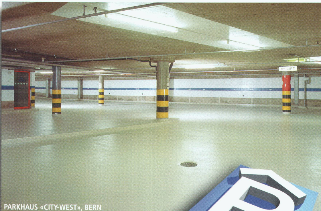
PARKHAUS «CITY-WEST», BERN