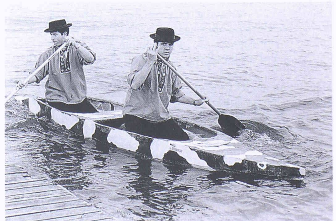
«La Mucca» mit schwarzweissem Design während des Wettkampfs in Heilbronn