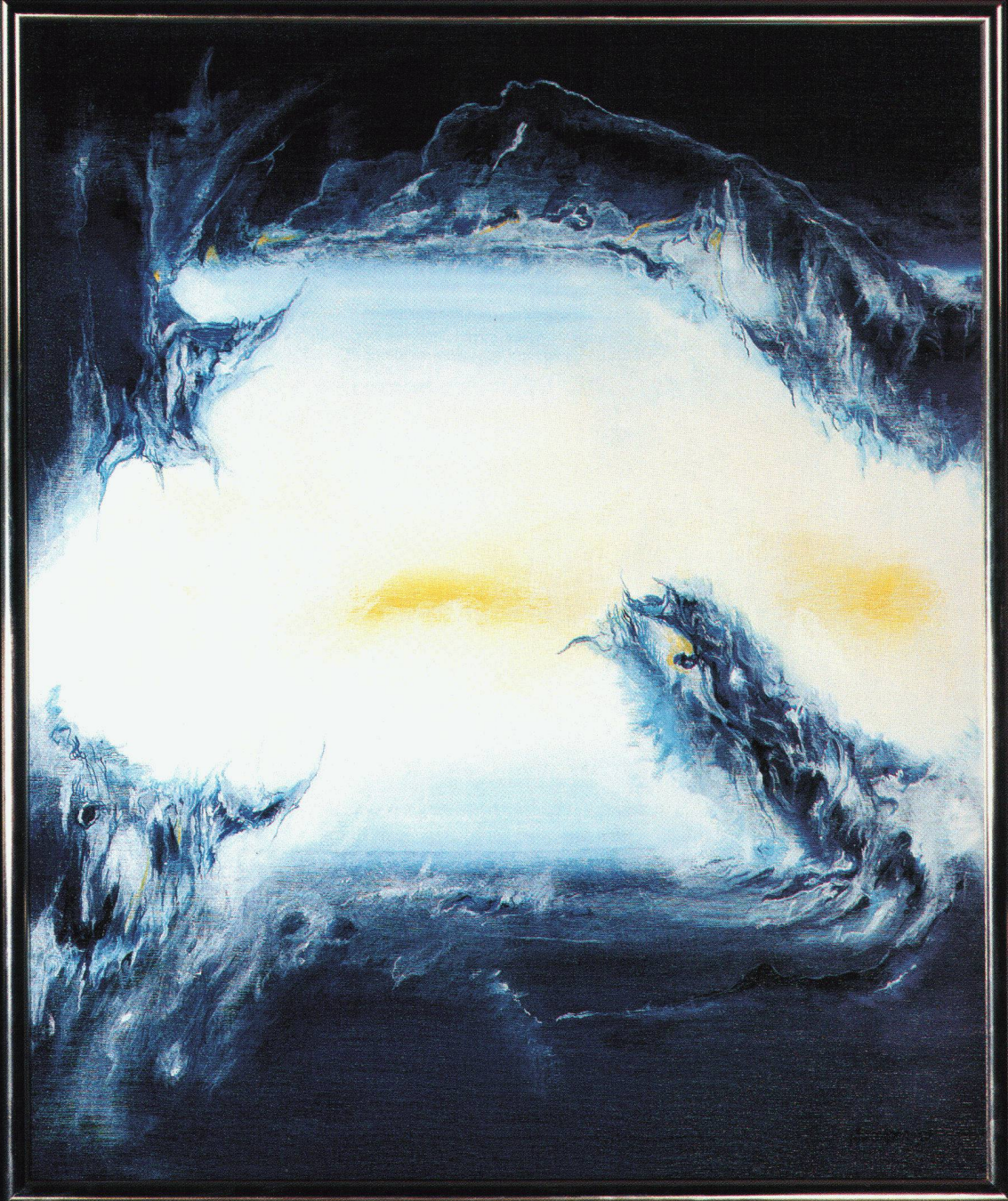
H.P. Werder «Dynamischer Zug», Oel auf Leinwand

schiedelkamin® schiedelkamin® schiedelkamin® schiedelkamin®