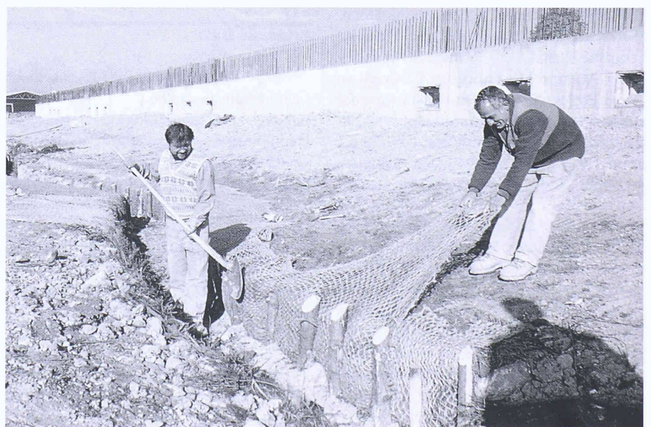
Bild 4. Transplantation von Ufervegetation des alten Baches; die Hochstaudensoden mit Kokosnetz zusammengehalten und Pfählen gesichert

Nach einer Bauzeit von rund 6 Wochen, kurz vor der Umleitung des Wassers ins neue Bachbett, wurden Fische und Krebse durch den kantonalen Fischereiauf-