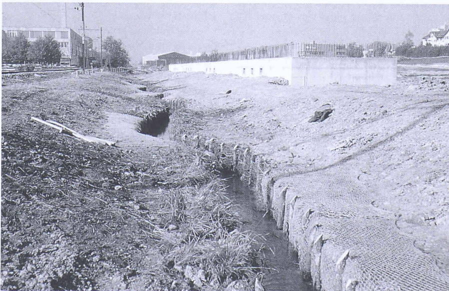
Bild 5. Mäandrierendes Normalwassergerinne, grosszügige Überflutungsmulde. Rechts verpflanzte Ufervegetation, links verpflanzte Riedvegetation

Um eine artenreiche Flora (Magerwiesen) zu fördern, wurde von einer Humusierung der in der Überflutungsmulde gelegenen Wiesen- und Böschungflächen abgesehen und die Ansaat aufgrund der späten Jahreszeit auf Frühjahr 1995 verschoben (Bild 5). Mit einer Aktion im November pflanzte der Naturschutzverein Gossau rund 150 standorttypische Sträucher in einzelnen Heckengruppen sowie 15 Korbweiden, die später zur traditionellen Kopfwidenform herangezogen werden sollen.