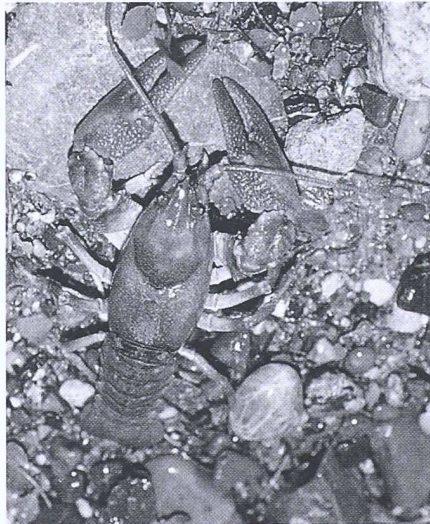
Bild 1. Der zum Symbol der Bachverlegung gewordene Steinkrebs. Ein ausgewachsenes Tier aus einer Population von rund 500 bei einer Bachlänge von nur 170 m

Für die Teilberichte «Biosphäre/Oberdorfbach», «Landschaftsbild» und «Nut-