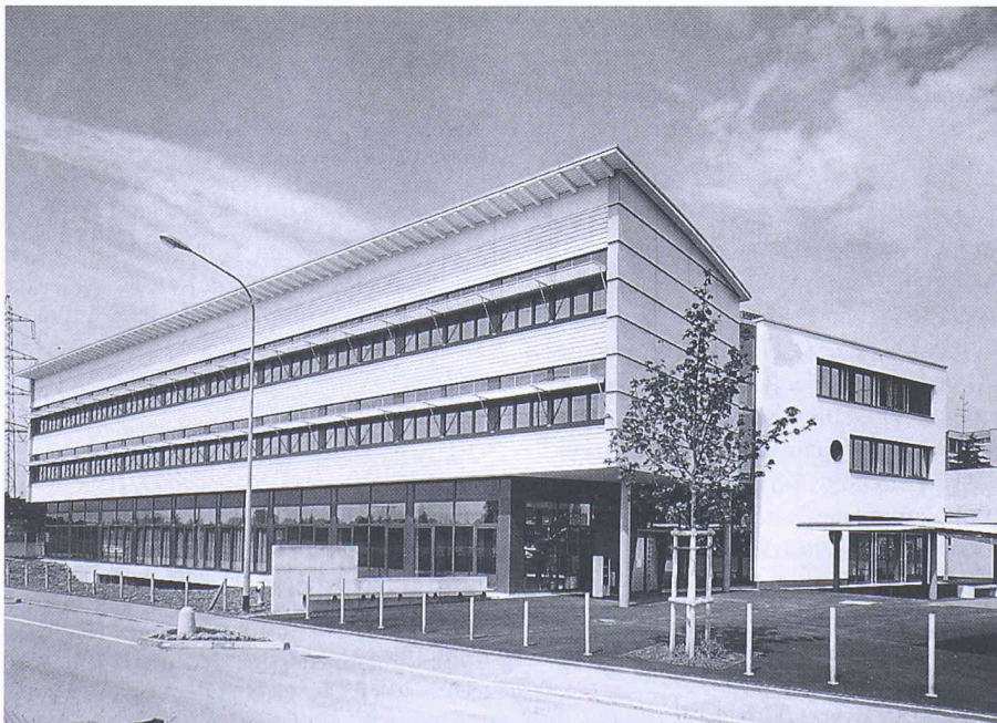
Klassenzimmertrakt mit Hauptzugang

Ein im Untergeschoss stationierter PC koordiniert die Eingabedaten und verwaltet die diversen Displays der Wand, steuert die Spielanzeigen und ist für das Kommunikationsmodul zuständig. Die Steuerungssoftware wurde speziell für die Wand hergestellt.