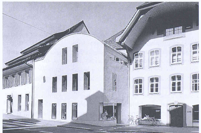
Baupreis der Stadt Aarau