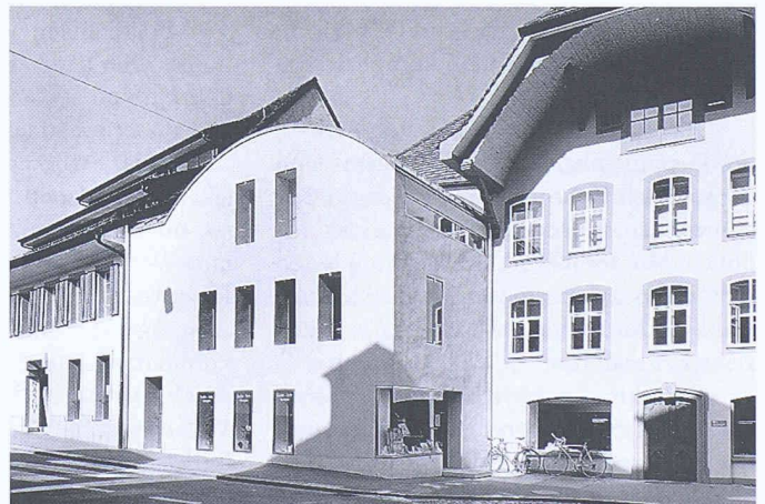
Baupreis der Stadt Aarau