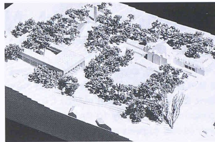
1. Rang. Dachtler Architekten AG, Horgen