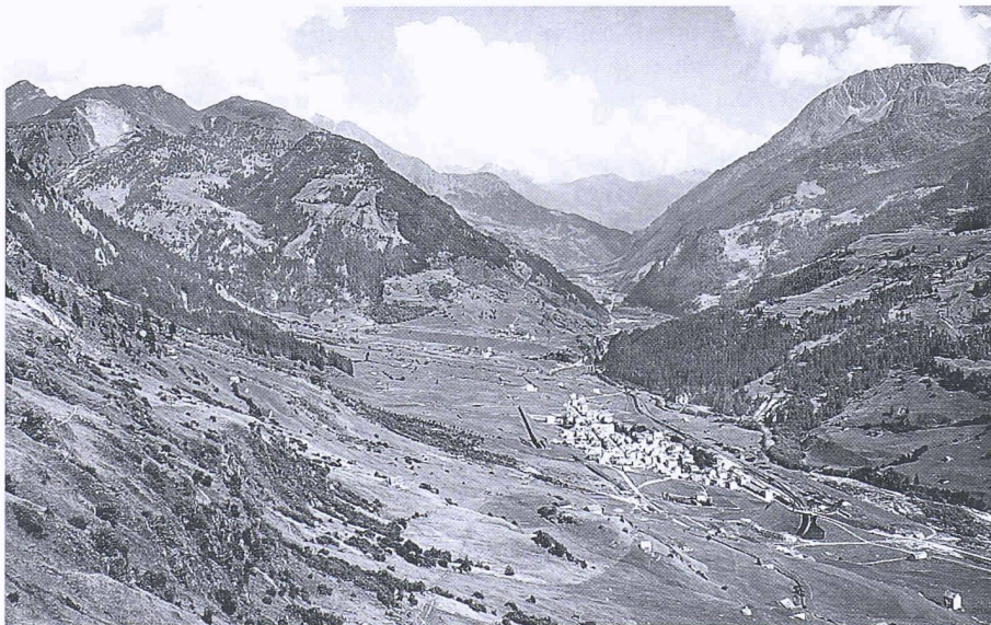
Ansicht von Airolo talabwärts ins Valle Leventina, in den 20er Jahren

Mit dem Zweck, aussagekräftige und objektive fotografische Dokumente dieser Veränderungen zu sammeln und allen Interessenten zur Verfügung zu stellen, wurde 1987 die Stiftung gegründet. Sie ist der Aufsicht des Eidg. Departements des Innern unterstellt. Das Archiv verfügt neben Ver-