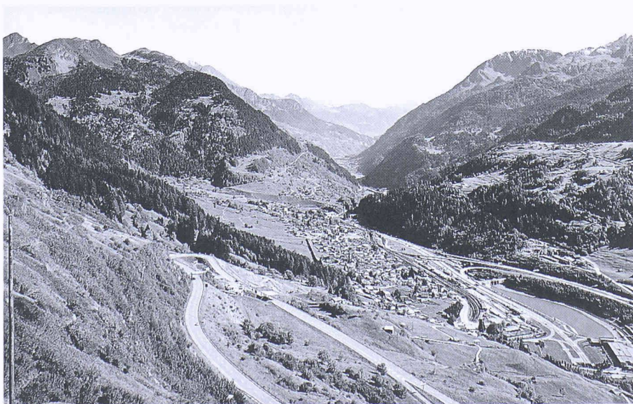
Die gleiche Sicht heute zeigt die Veränderungen: Siedlungszunahmen, Strassenbau,