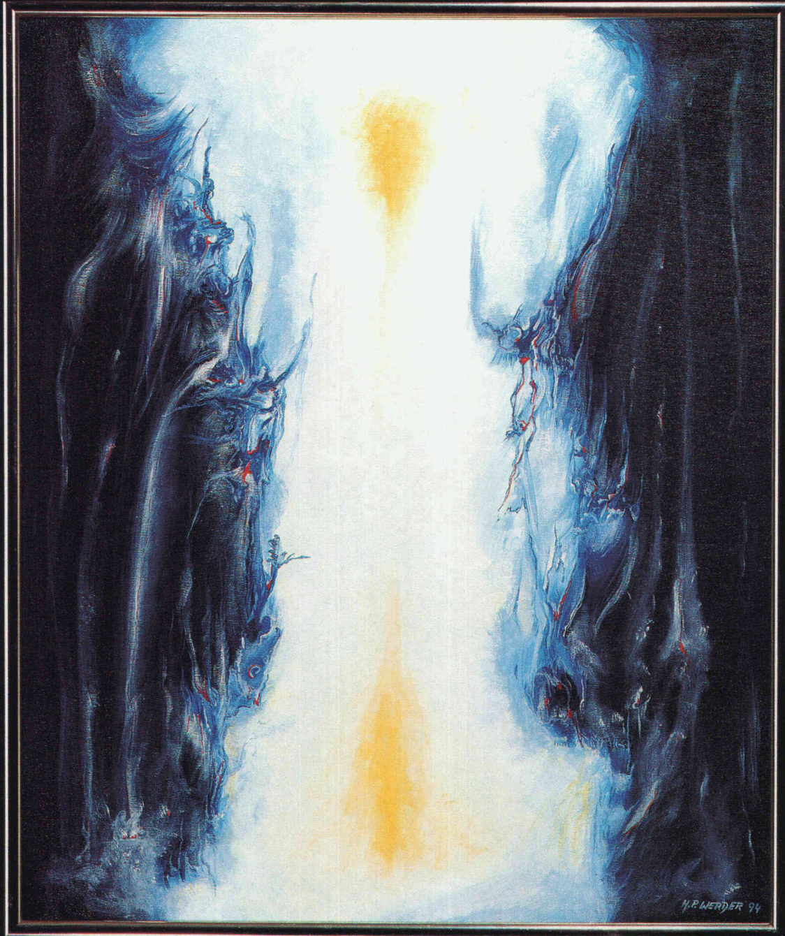
H.P. Werder «Durchbruch», Oel auf Leinwand

schiedelkamin schiedelkamin schiedelkamin schiedelkamin schiedelkamin