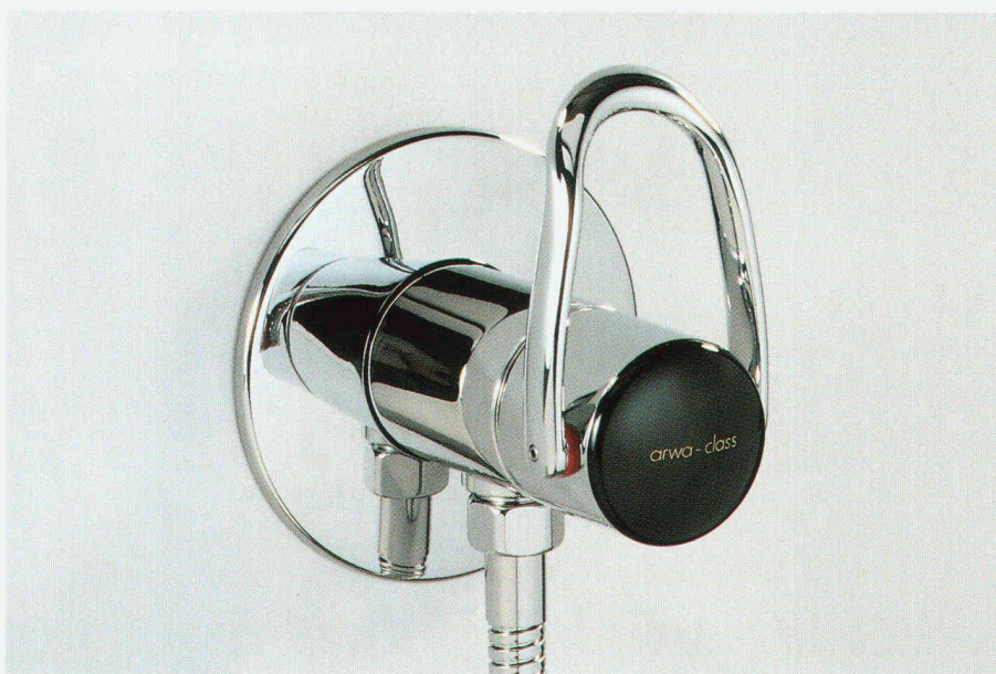
Duschenmischer arwa-class «1Point»