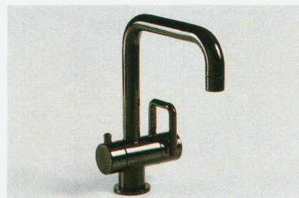
Waschtischmischer arwa-twin «1Point» (mit Eckadapter zum Rohbauset)