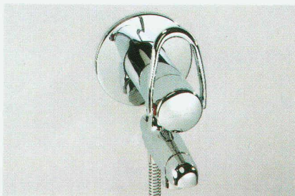
Bademischer arwa-class «1Point»