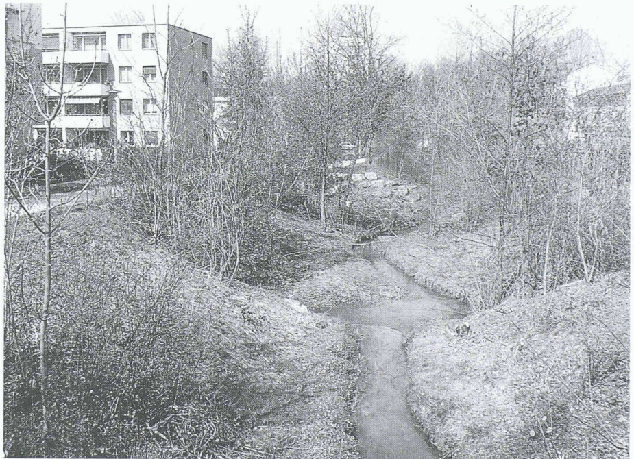
Ein grosses Anliegen des Wettbewerbs zum Europäischen Naturschutzjahr betraf die Sensibilisierung der Bevölkerung für ihren Lebensraum. Im Themenbereich «Wasserbau» galt die Hauptbestrebung dem Wiedersichtbarmachen von Wasserläufen in Siedlungen und Landschaft