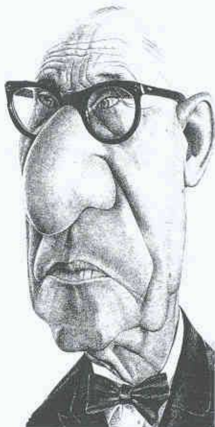
Valott: Le Corbusier (Bild: Karikatur- & Cartoon-Museum Basel)

Die Sammlung umfasst derzeit 3000 Originalzeichnungen von gegen 700 Künstlern und Künstlerinnen aus der ganzen Welt. Zum Museum gehören auch eine Bibliothek, die während der Öffnungszeiten dem Publikum zur Verfügung steht, und ein Museum-Shop, der Bücher, Plakate und Karten aus dem Bestand des Museums als Mitbringsel anbietet. - Die Ausstellung «Architekt-ur-Welten» dauert