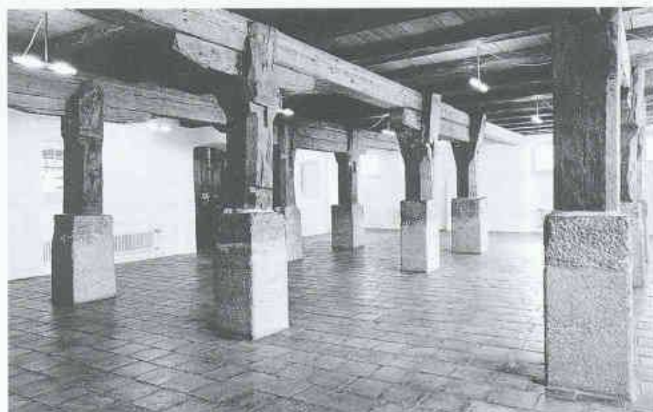
Bei der südlichen Rathauhalle handelt es sich um die ehemalige Markthalle der Stadt Thun