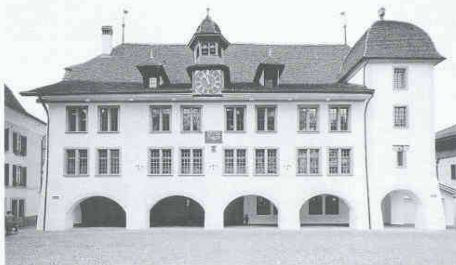
Die repräsentative Platzfassade des Rathauses wird im Erdgeschoss durch die Arkadenreihe und den bereits 1585 angebauten Turm geprägt