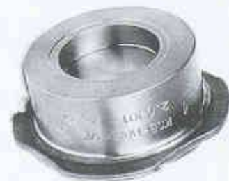
Kompakt und mit geringem Durchflusswiderstand; Einklemm-Rückschlagventile Boa®-RVK

Boa®-RVK-Rückschlagventile zeichnen sich durch geringe Druckverluste aus und eignen sich für Flüssigkeiten, Dämpfe und Gase. Bevorzugte Einsatzgebiete sind Industrie- und Heizungsanlagen. Es stehen zwei Ausführungen zur Verfügung. Das Modell mit einer Dichtplatte aus Edelstahl bzw. Grauguss deckt die Druckstufen PN 6/10/16 in den Nennweiten DN 15 bis 200 ab und ist für eine maximale Betriebstemperatur von 260°C zugelassen. Die PN-6-Aus-