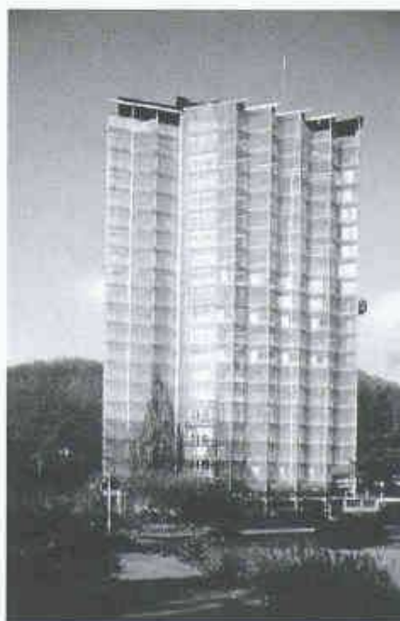
Kantonsspital Olten, Fassadensanierung Personalhaus

Stahlkonsolen: 2880 m Aluminiumprofile: 6000 m Glasfläche: 2200 m 2 (50 Tonnen) Isolationsfläche: 2400 m 2 Schrauben, Nieten: 16 000 Kleb- und Schlaganker: 3300