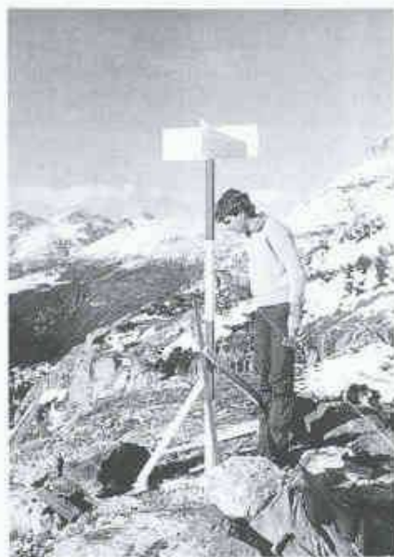
2 Signalisierung der Triangulationspunkte

Fachpersonal und Maschinen stillgelegt werden. Ob die Unternehmung einen eigenen Vermessungsdienst aufbaut oder ob sie die Dienste eines lokalen Vermessungsbüros in Anspruch nimmt, liegt in ihrer Entscheidung, wird aber stark vom Umfang der zu bewältigenden Vermessungsaufgaben beeinflusst. Beim Zugwald- und dem Vereinatunnel mit TBM-Vortrieb entschied sich der Unternehmer für einen eigenen Vermessungsdienst. Beim Bau jedes Bauwerks können Phänomene auftreten, die eine mehr oder weniger intensive Überwachung bedingen. Beim Tunnelbau sind dies unter anderem Hang- und Stützmauerüberwachungen im Portalbereich sowie die Kontrolle des Tunnelprofils. Für die Überwachung im Portalbereich sind oft geodätische Verfahren nötig, die durch einen entsprechend ausgerüsteten Vermessungsdienst oder durch einen bestellten Spezialisten ausgeführt werden. Die Kontrolle der Tunnelprofile kann mit relativ einfachen Mitteln (Nivellement, Konvergenzmessungen) durch die Bauleitung oder einen externen Fachdienst durchgeführt werden.