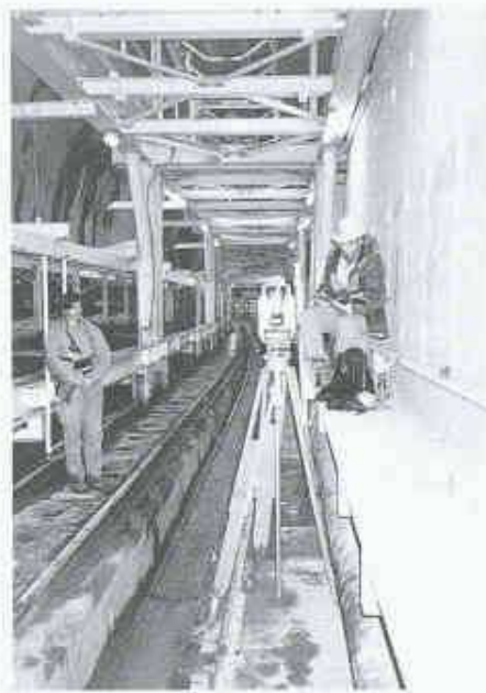
3 Vereina Nord, Kontrollpunkt im Bereich des Nachläufers

Aufgrund der langjährigen Erfahrung der beauftragten Vermessungsfachleute werden die Messungen bei den Hauptkontrollen in der Tunnelachse durchgeführt. Mit dieser Methode minimieren sich die Einflüsse der Seitenrefraktion, was neueste Untersuchungen bei der Absteckung des Kanaltunnels wiederum bestätigt haben. Zu diesem Zweck werden in regelmässigen Abständen Hauptpunkte in Achsnähe mit zusätzlichen vier Rückversicherungen an den Tunnelwänden versichert. Die Abstände im geraden Tunnel