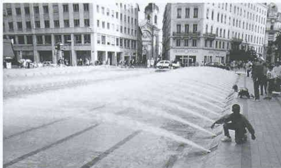
Place de la République

Wie bei der Börse ist auch die Place des Celestins 6 einem öffentlichen Gebäude, dem Theater, vorgelagert. Die Haltung ist hier aber eine grundsätzlich andere, weil