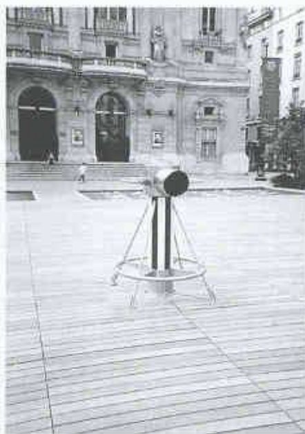
Place des Celestins

Räume zu verbinden, doch Erfolg beschieden. Der Anspruch der Stadtverwaltung, «dass die öffentliche Räume in der Stadtplanungspolitik eine Priorität genießen sollten, die der des Wohnens gleichkommt», konnte eingelöst werden, und man spürt, dass die Eingriffe eine positive Ausstrahlung haben werden, weil hier auf der Grundlage einer genauen Kenntnis der städtebaulichen Prämissen auch ein Risiko eingegangen wurde, gewohnte Bilder in neue Wirklichkeit zu transformieren.