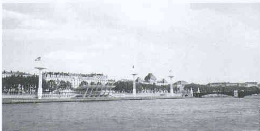
Die Rhone mit der Piscine du Rhône 2

Neben den gepressten, gekurvten, pittoresken Strassenzügen am Fusse des Hügels erstreckt sich ein offenerer Teil, das eigentliche Zentrum der Stadt, auf der Halbinsel zwischen den beiden Flüssen,