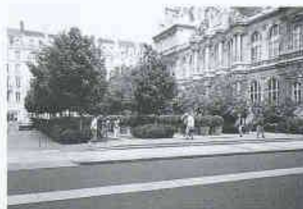
Place de la Bourse

als repräsentatives Vorfeld der Börse gedacht, ist dafür aber etwas schmal. Unmittelbar vor der monumentalen Freitreppe, etwas versetzt, liegt der Treppenaufgang aus der neuen Tiefgarage. Die relative Enge des Platzes ist nun überspielt nicht mit irgendwelchen raumweitzenden Massnahmen, sondern im Gegenteil mit einer äusserst dichten, gereihten halbhohe Bepflanzung, die zum Teil in Rabatten, zum Teil in Kübeln steht. In diese bewegte, künstlich-natürliche Topographie sind sparsam Bänke eingelassen, die eine Art offene Intimität ermöglichen und einen Ort schaffen, wie ihn Städte oft, Plätze aber nur selten kennen.