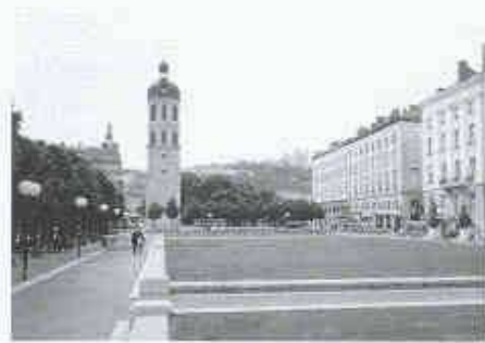
Place Antoine Poncet

Auch wenn in einzelnen Bereichen also Fragen offenbleiben, so scheint den Bemühungen, den Bau von Tiefgaragen mit einer Neuformulierung städtischer