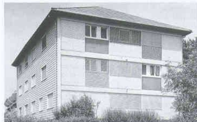
5 Wohnhaus und Restaurant Seehus in Hergiswil am Vierwaldstättersee: Die Stiftung für besondere Leistungen im Umweltschutz zeichnete den ökologisch ausgerichteten Um- und Anbau mit dem Preis 1996 aus. In der Mitte der Fassade: Rohre der Wärmerückgewinnungsanlage