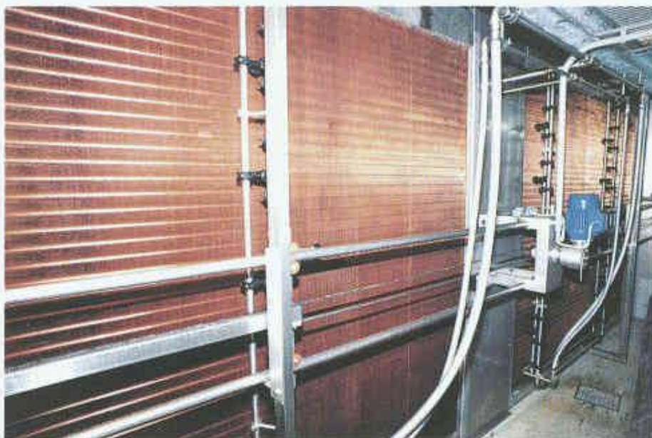
4 Ansicht untere Wärmetauscherbatterie mit Düsenstöcken und deren Getriebeantriebsmotor