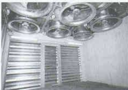
5 Ansicht aus der Ventilator-kammer Richtung axiale Ausblasventilatoren und den luftdichten Klappen nach den Rückkühlbatterien

Beim Trocken- wie beim Nassbetrieb fördern die parallel geschalteten, drehzahleregelten Ventilatoren nur soviel Luft durch die Rückkühlbatterien, wie erforderlich ist, um die gewünschte wasserseitige Austrittstemperatur zu erreichen.