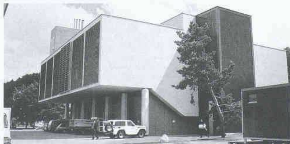
1 HEZ-Rückkühlgebäude mit den Ansauggittern

Aus diesen Randbedingungen wurde vom AFB ein Pflichtenheft für den Planer erstellt. Die Zielsetzung war, über eine öffentliche Ausschreibung die optimalste Lösung aus dem Markt zu erhalten.