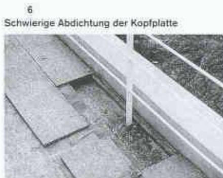
Das falsche Material am richtigen Ort