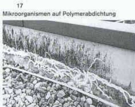
17 Mikroorganismen auf Polymerabdichtung