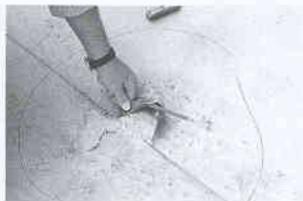
7 Unsorgfältige Verschweissung