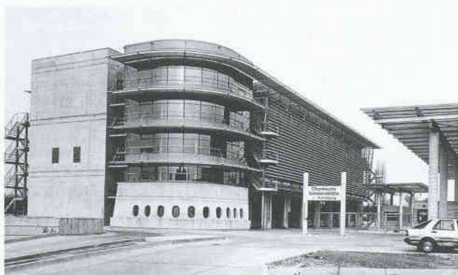
Die neue Kantonale Sonderabfallsammelstelle im Hagenholz Zürich