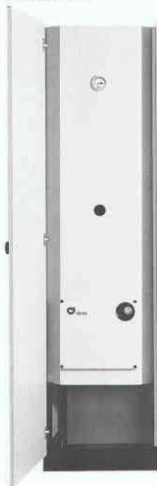
Schrankboiler Cipagglas Typ CGA 210-300 l