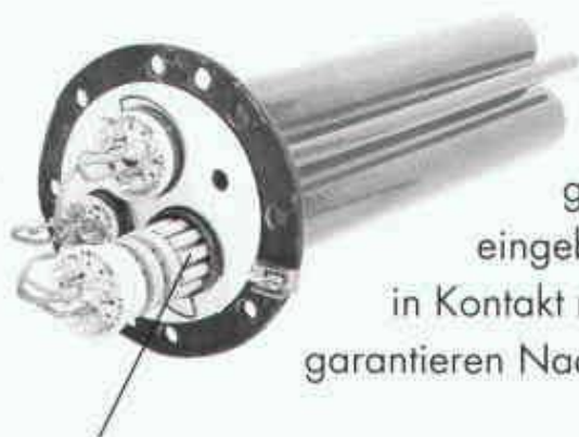
Die Heizelemente sind in Schutzrohren eingebaut

eingebaut, kommen deshalb nie in Kontakt mit dem Wasser und garantieren Nachtruhe.