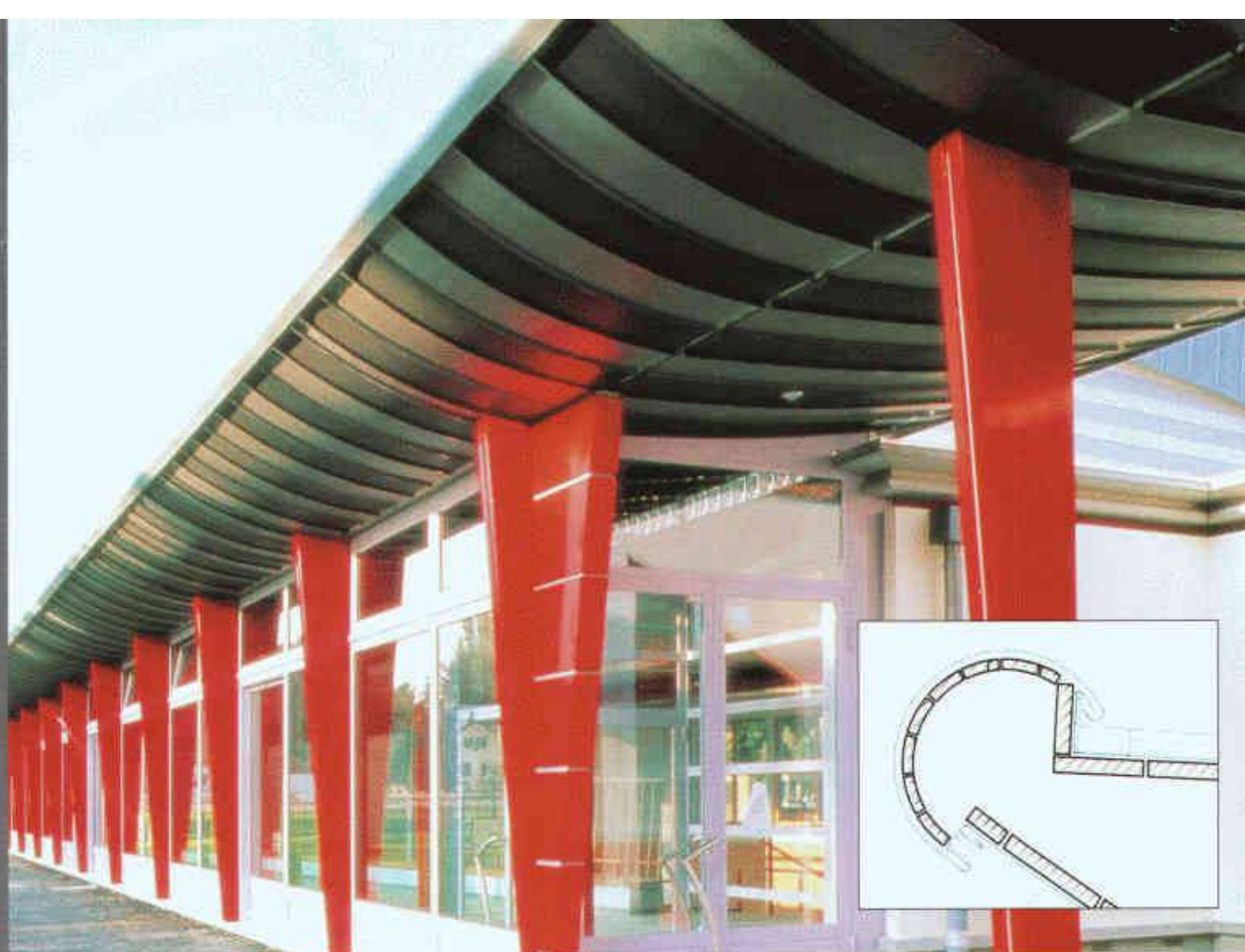
Salle de gymnastique, 1294 Genthad. Architekten: Redard-Barro-Maidinger, 1227 Carouge. Spengler: Cerutti Toiture SA, 1226 Thônex.