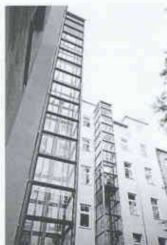
Aufzugsystem Schindler 200

Gleich zweimal hintereinander ist ein Produkt des Aufzugherstellers Schindler mit Design-Preisen ausgezeichnet worden. Nachdem das Industrie-Forum Design Hannover das Aufzugprogramm Schindler 200 bereits letztes Jahr würdigte und in die Liste der zehn Besten aufnahm, erhielt es nun in Frankfurt den deutschen Bundespreis für Produktdesign.