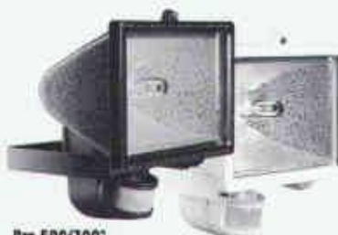
Pro 500/200* E-No. 924 602 019