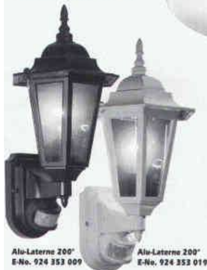
Alu-Laterne 200* E-No. 924 353 009