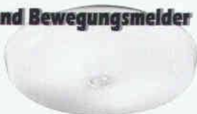
Cerclampe 360* Deckenmontage E-No. 913 721 609