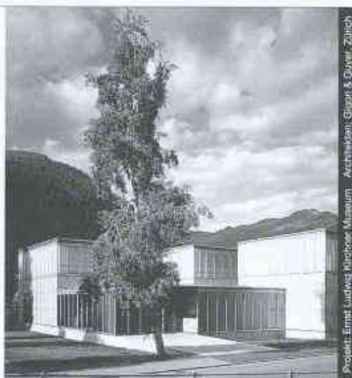
Projekt: Ernst Ludwig Muthesee Museum Architekt: Gigut & Düvel Zürich