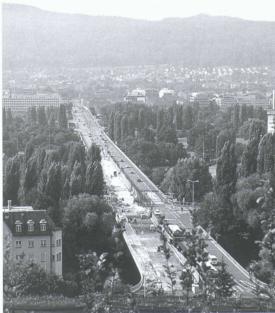
1 Instandsetzung der Brückenoberfläche in Etappen

Ein weiterer Vorteil dieses Vorgehens war, dass mit der anschliessenden gross-