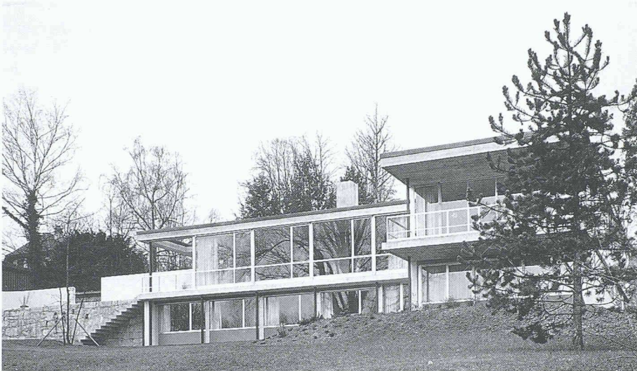
Einfamilienhaus Sälarain, Solothurn, Architekt: Hans Luder, 1960

eigenes Büro in Solothurn. Die Zeit der Selbständigkeit wurde aber überschattet vom Zweiten Weltkrieg. Der noch junge Architekt musste neben dem Aufbau seines Büros laufend Aktivdienst leisten, was den Aufbau des jungen Betriebes verständlicherweise enorm erschwerte. Aus dieser belasteten Zeit stammen u.a. ein Industriegebäude in Langendorf sowie Einfamilienhäuser in Solothurn, Riedholz und Hertenstein.