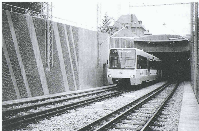
Bei der S-Bahn Stuttgart wurden u.a. Stützmauern und Tunnelportale