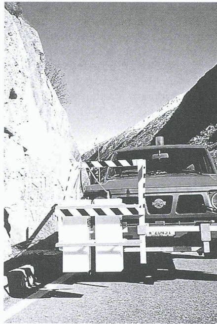
Mobile Georadaranlage im Einsatz

Das Verfahren beruht auf einem elektromagnetischen Signal, das von einer Antenne abgestrahlt wird. Es dringt in das untersuchte Objekt ein und wird an Grenzflächen, wie beispielsweise der Unterseite