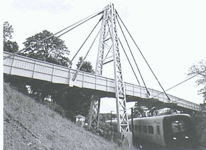
Die Fiberline-Brücke im dänischen Kolding

Damit baut die Nemetschek AG ihre Marktführerschaft weiter aus. Heute entscheiden sich in Deutschland bereits 34 Prozent aller Architekturbüros bei einem Neueinstieg für die CAAD-Software der Nemetschek-Gruppe. 5 Prozent arbeiten mit acadGraph. Mit der Übernahme setzt Nemetschek verstärkt auf Kompatibilität. Künftig können Softwarelösungen auf der Basis offener Datenstrukturen geboten werden. Das heisst, dass unterschiedliche Systeme problemlos miteinander kommunizieren können. Für die bisherigen Kunden von acadGraph bedeutet dies, dass sie einerseits ihr gewähltes Softwaresystem weiter im Einsatz behalten, gleichzeitig aber den Vorteil haben, alle weiteren Lösungen des Marktführers nutzen zu können. Nemetschek Fides & Partner AG 8304 Wällisellen Tel. 01/839 76 76