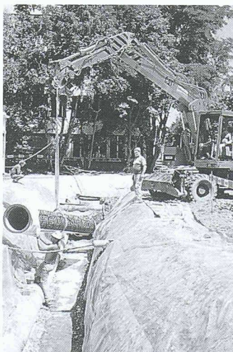
Per Bagger lassen sich die Geopur-Rohre schnell und problemlos im Graben absetzen

Abwasser- und Abrasionsbeständigkeit standen für die Bauherrschaft, das Tiefbauamt der Stadt Luzern, denn auch im Zentrum der Anforderungen an das neue Rohr. Geopur, das duktile Gussrohr mit