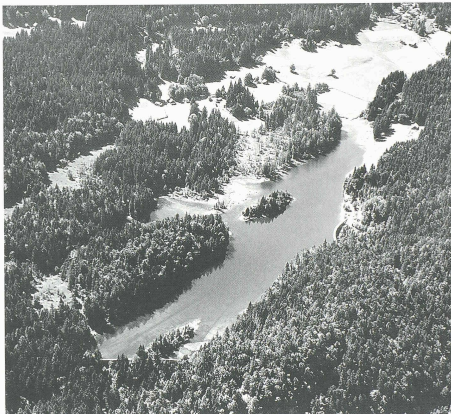
Der Chapfensee, heute ein Naturschutzgebiet mit wertvollen Hochmooren, wird seit fünfzig Jahren zur Stromproduktion genutzt

Als während des Zweiten Weltkrieges die Nachfrage nach elektrischer Energie in der Schweiz stark anwuchs, beauftragte auch der Gemeinderat Mels (St. Galler Oberland) eine Ingenieurarbeitsgemeinschaft mit der Ausarbeitung eines Kraftwerkprojekts. Dieses sah die Zusammenfassung von vier Bergbächen sowie die Erstellung eines Speicherbeckens vor, das dank zweier Staumauern einen Inhalt von 500 000 Kubikmetern aufweisen sollte. Nach langwierigen Verhandlungen konnte 1946 mit den Nordostschweizerischen Kraftwerken (NOK) ein Stromlieferungsvertrag abgeschlossen werden, der dieses Unternehmen zur Abnahme der über den Eigenbedarf der Gemeinde Mels hinausgehenden Energiemenge verpflichtete. Die Bauarbeiten und die Herstellung und Montage der mechanischen und elektrischen Ausrüstung wurden 1947 mit allen Mitteln beschleunigt, so dass die Turbinengruppe nach weniger als einem Jahr Bauzeit am 12. Januar 1948 ihren definitiven Betrieb aufnehmen konnte.