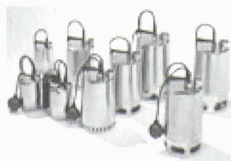
KP- und AP-Tauchmotorpumpen

Für grössere Leistungen und Abwässer mit Feststoffen bis zur Korngrösse von 50 mm oder mit faserigen Bestandteilen gibt es die Schmutzwasserpumpen AP 12, AP 35 und AP 50. Ihr integrierter Kühlmantel sorgt für einen zuverlässigen Dauerbetrieb und ruhigen Lauf, auch wenn die Pumpe nicht vollständig eingetaucht arbeitet.