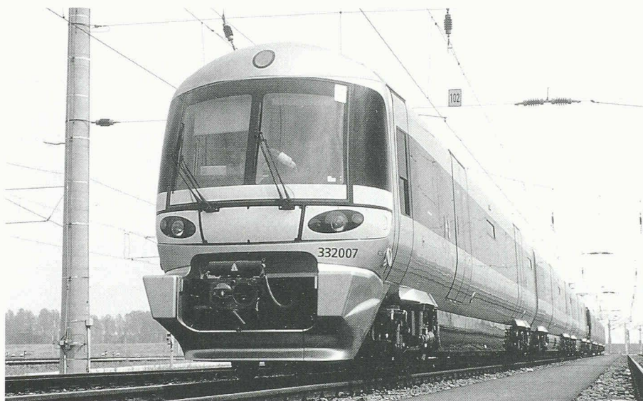
Seit dem 1. Juni 1998 sorgt der Heathrow Express für eine schnelle Verbindung zwischen Flughafen und Londoner Innenstadt