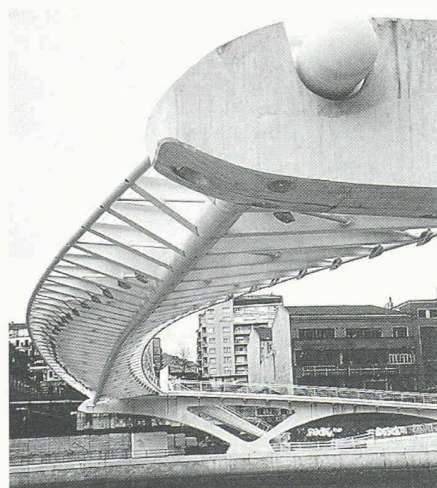
Die Zubizuri-Fussgängerbrücke von Santiago Calatrava, deren seitlicher, noch geschlossener Abgang zum Guggenheim-Museum führt