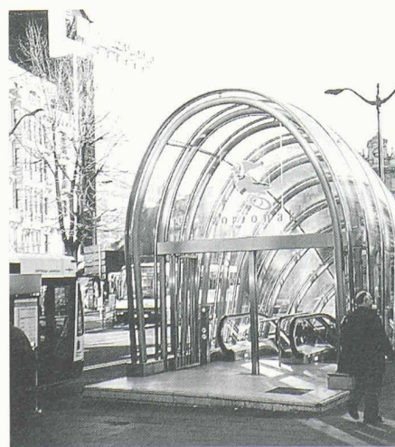
Die Eingänge zur Metro hat der Volksmund nach ihrem Schöpfer «Fosteritos» getauft

In der Lobby des Hotels «Nervión» in Bilbao herrscht ein rechtes Menschengewimmel. «Vamos a ver al señor Guggenheim!» ruft ein begeisterter spanischer Vater seiner vielköpfigen Sippe zu. Spanier, Franzosen, Amerikaner: Wie der Schreibende sind sie alle zum Besuch ebendieses Herrn Guggenheim angereist, der neuen Sehenswürdigkeit der Stadt, des bereits weltberühmten Museums von Frank Gehry.