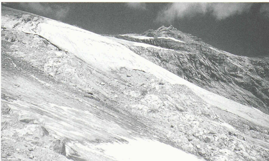
Heute Ruhe – morgen Rummel. Das künftige Gletscherskigebiet am Hockenhornglat in Wiler VS