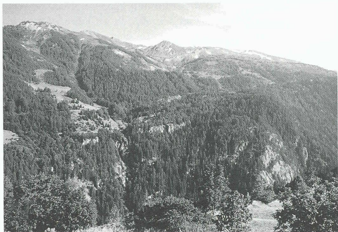
Tête de Balme VS: Die intakte Landschaft auf der Schweizer Seite (Blick von Giétroz)