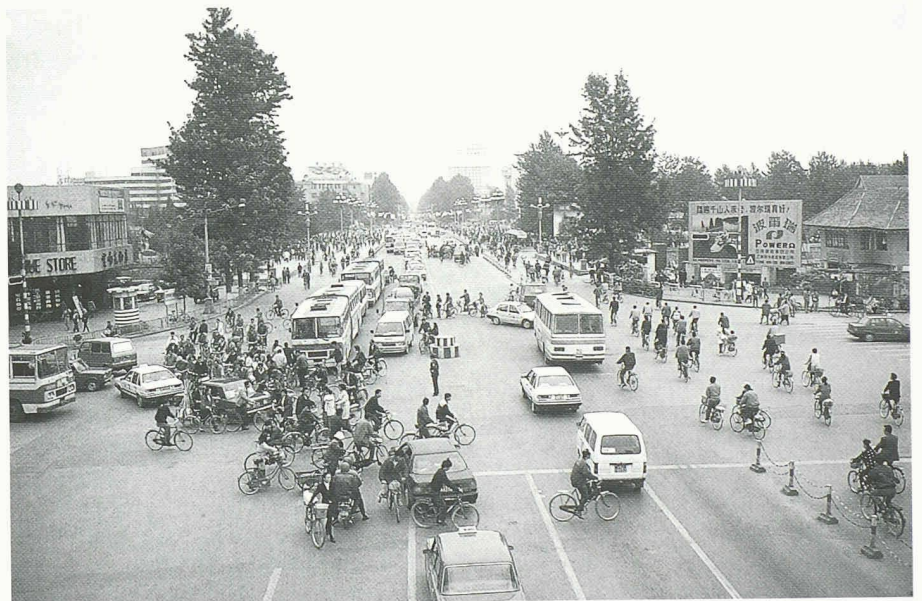
Dieses Bild der Dongfeng-Strasse verdeutlicht die heutigen Anteile der verschiedenen Verkehrsarten in Kunming: Fussgänger 33%, Velofahrer 56%, öffentlicher Verkehr 6%, motorisierter Individualverkehr 5%

Zur Entlastung dieser beiden Netze ist langfristiger Ausbau eines S-Bahn-Netzes vorgesehen, das bis in die Region (Satellitenstädte) hinausgreift. Die Förderung