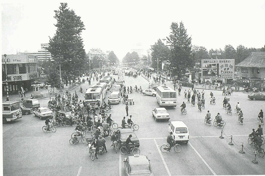
Dieses Bild der Dongfeng-Strasse verdeutlicht die heutigen Anteile der verschiedenen Verkehrsarten in Kunming: Fussgänger 33%, Velofahrer 56%, öffentlicher Verkehr 6%, motorisierter Individualverkehr 5%

Zur Entlastung dieser beiden Netze ist langfristiger Ausbau eines S-Bahn-Netzes vorgesehen, das bis in die Region (Satellitenstädte) hinausgreift. Die Förderung