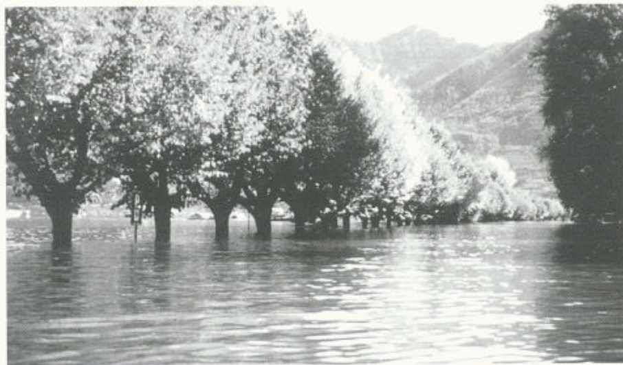
Überschwemmung des Lago Maggiore nach einer Serie von Starkniederschlägen im Oktober 1993: Die atmosphärischen und hydrologischen Prozesse, die hinter solchen Ereignissen stehen, werden im internationalen Forschungsprogramm MAP erforscht. Im Herbst 1999 werden dazu intensive Wetterbeobachtungen durchgeführt