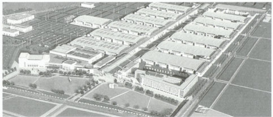
Neue Messe München: ebenerdige, stützenfreie Hallen, grosszügige Grün- und Erholungsflächen