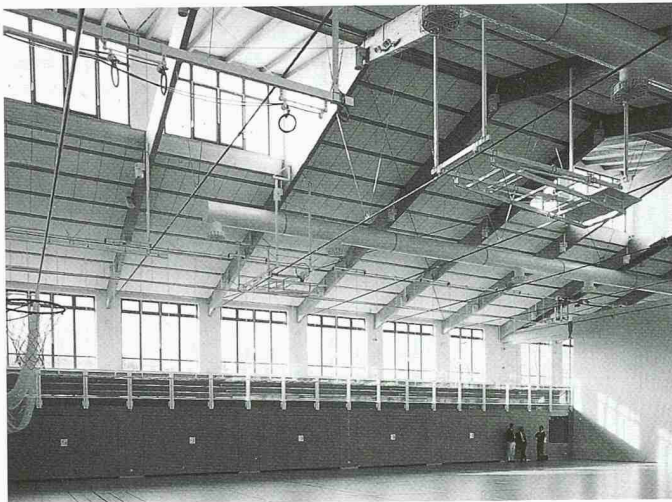
Der Sporthallenbau ist ein wichtiges Einsatzfeld für Dachelemente. Der Nachweis der Ballwurfsicherheit gem. DIN 18032, Teil 3, erleichtert die Planung solcher Hallen