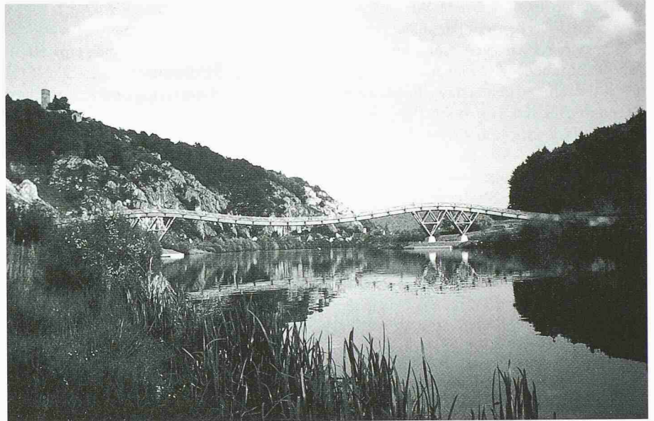
Spannbandbrücke über den Main-Donau-Kanal bei Essing von Richard J. Dietrich