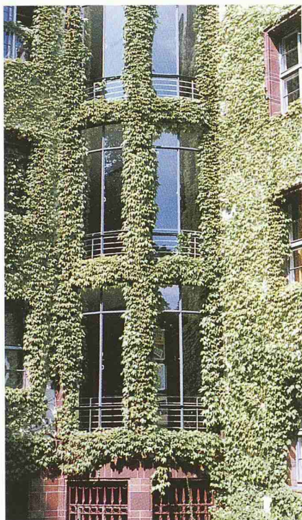
Links: Vegetative Fassadengestaltung in Berlin, 1995; unten: extensive Begrünung eines Einkaufszentrums in Berlin, 1998