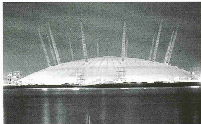
Millennium Dome London, 1998

RAG Reichenberger AG 6038 Gisikon Tel. 041/455 01 11