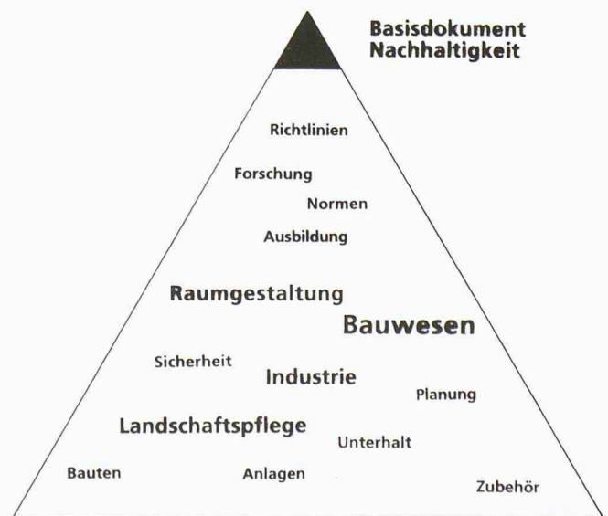
Aktivitäten des SIA