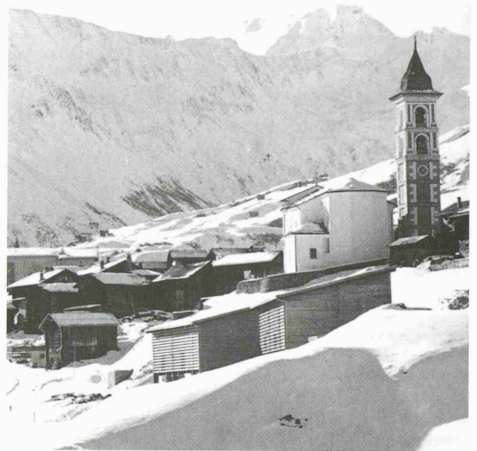
In Vrin GR entstand - unter Mitwirkung zahlreicher Beteiligter - ein einzigartiges Dorfmodell, das längerfristig das Leben und Arbeiten im Dorf zukunftsfähig macht

Im Bereich der Wirtschaft geht es vor allem darum, Signale und Rahmenbedingungen zu setzen sowie Mechanismen und