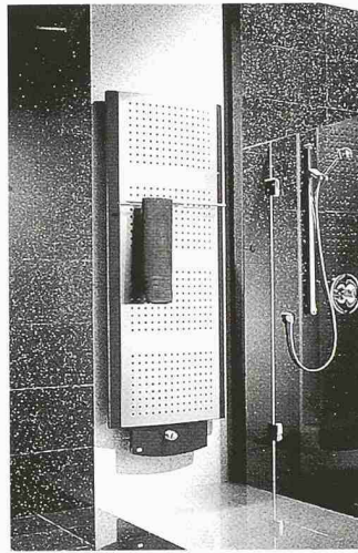
Heizkörper Credo-Techno

Die Keller AG Ziegeleien haben sich darauf eingestellt und bieten für alle üblichen Fassadenmauerwerke in Backstein massgeschneiderte Lösungen, die diese