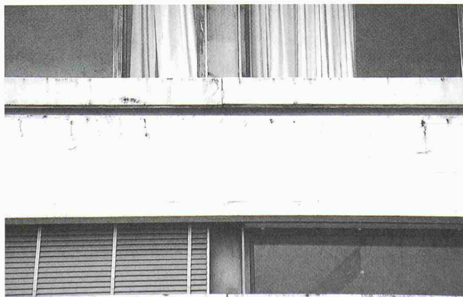
3 Typisches Schadens- bild an den Längsbän- dern des Klassentrakts

Die Muster des starren Systems überzeugten insbesondere Denkmalpflege und Architekten; sie wünschten eine entsprechende Behandlung auf allen Betonflächen (Bild 5). Demgegenüber bevorzugten die Bauherrschaft und die Ingenieure ein vollflächig elastisches System, das eine stark verlangsamte Schadensentwicklung gewährleistet. Als Kompromiss wurde vereinbart, das risseüberbrückende System nur am Dachrand und bei der Attika einzusetzen, wo sowohl die Rissneigung wie auch die Bewitterung am grössten sind. Bei den tieferliegenden horizontalen Bändern sowie bei gebäudehohen Wandscheiben ist vorgesehen, das starre System mit der Injektion von Rissen zu ergänzen. Auf einen verbesserten Schutz der Fassaden durch Abdeckbleche auf Kronen und Brüstungen ist aus gestalterischen Gründen zu verzichten; Verunreinigungen der weissen Oberfläche (z.B. Wasserläufe) und eine allenfalls vorzeitige Alterung des Farbanstrichs werden in Kauf genommen. Demgegenüber weist die mineralische Beschichtung, die durch Verkieselung auf dem Untergrund haftet, den ökologisch und ökonomisch grossen Vorteil auf, dass sie problemlos mit Hochdruck gereinigt und später überstrichen werden kann. Eine aktualisierte Kostenschätzung zeigt, dass der finanzielle Rahmen voraussichtlich eingehalten werden kann.