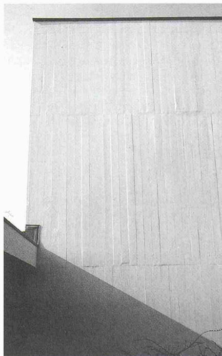
Aussenwand nach Instandsetzung (starres System)